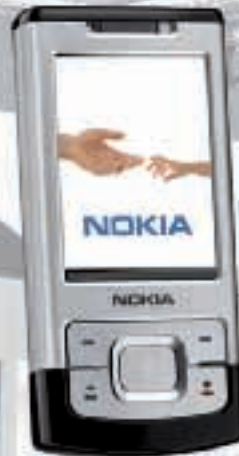
Nokia 6500 slide VL

49.-* *NATEL Swiss Liberty 24 Monate ohne Abo CHF 499.-