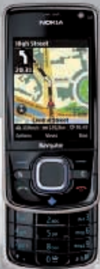
Nokia 6210 VL Golden Talents

99.-* *NATEL Swiss Liberty 24 Monate ohne Abo CHF 549.-